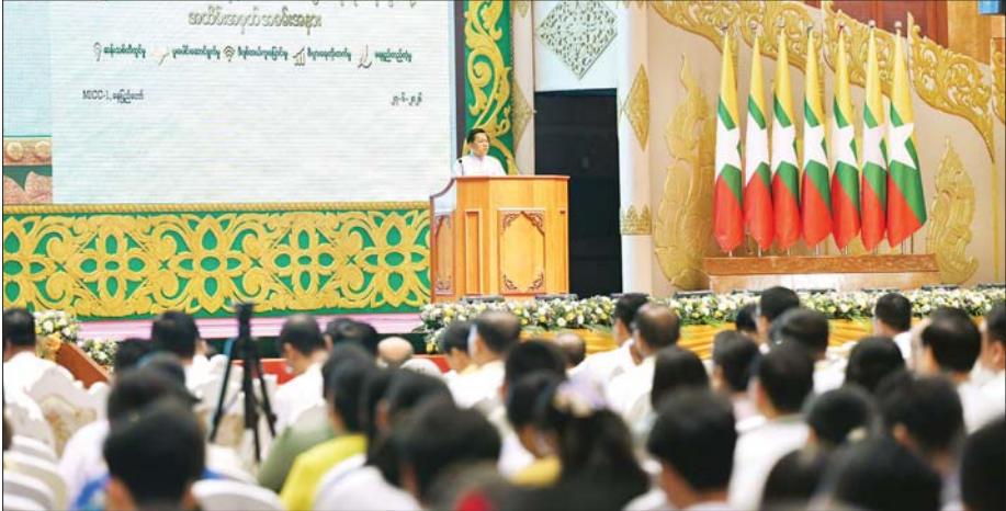
နိုင်ငံတော်သမ္မတ ဦးမင်းအောင်လှိုင် ကမ္ဘာ့အသေးစား၊ အငယ်စားနှင့်အလတ်စားစီးပွားရေးလုပ်ငန်းများနေ့ (World MSME Day) အထိမ်းအမှတ်အခမ်းအနားတွင် အမှာစကား ပြောကြားစဉ်။

ကုလသမဂ္ဂ၏ ရေရှည်စဉ်ဆက်မပြတ် ဖွံ့ဖြိုးတိုးတက်မှု ပန်းတိုင်များကို အကောင်အထည်ဖော်ရာတွင် MSME များသည် အဓိကကျသည့် အခန်းကဏ္ဍမှ ပါဝင်လျက်ရှိကြောင်း၊ ထို့ကြောင့် ကမ္ဘာ့စီးပွားရေးမဏ္ဍိုင်နှင့် ရေရှည်စဉ်ဆက်မပြတ် ဖွံ့ဖြိုး