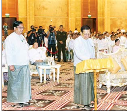
နိုင်ငံတော်သမ္မတ ဦးမင်းအောင်လှိုင် ကမ္ဘာ့အသေးစား၊ အငယ်စားနှင့် အလတ်စား စီးပွားရေးလုပ်ငန်းများနေ့ အထိမ်းအမှတ်အခမ်းအနားကို ဒီဂျစ်တယ်နည်းပညာအသုံးပြု၍ ဖွင့်လှစ်ပေးစဉ်။

ကုန်ကြမ်းအနေဖြင့် မိမိတို့နိုင်ငံသည် စိုက်ပျိုးရေးကို အခြေခံသည့် နိုင်ငံဖြစ်သောကြောင့် သွင်းကုန်အစားထိုးခြင်းကိုလည်း လက်တွေ့ကျကျ အကောင်အထည်ဖော်နိုင်မည်ဖြစ်ကြောင်း။