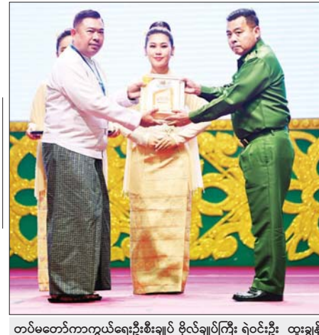
တပ်မတော်ကာကွယ်ရေးဦးစီးချုပ် ဗိုလ်ချုပ်ကြီး ရဲဝင်းဦး ထူးချွန်အဆင့်(၃) MSME လုပ်ငန်းရှင်တစ်ဦးအား ဂုဏ်ပြုတံဆိပ် ချီးမြှင့်ပေးအပ်စဉ်။