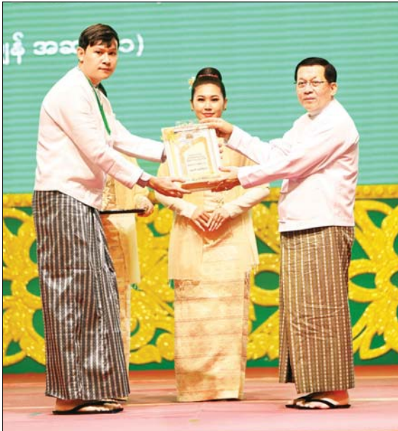
နိုင်ငံတော်သမ္မတ ဦးမင်းအောင်လှိုင် ထူးချွန်အဆင့်(၁) MSME လုပ်ငန်းရှင်တစ်ဦးအား ဂုဏ်ပြုတံဆိပ် ချီးမြှင့်ပေးအပ်စဉ်။

လက်ရှိအချိန်တွင် ပြည်တွင်း MSME များသည် ကမ္ဘာ့ MSME များနည်းတူ ငွေကြေးအရင်းအနှီး ဌ အခက်အခဲများရှိနေခြင်း၊ နည်းပညာ နောက်ကျနေခြင်း၊ ဈေးကွက်ဝင်ရောက်နိုင်မှု အား နည်းခြင်း၊ ကျွမ်းကျင်လုပ်သား မလုံလောက်ခြင်း၊ ထောက်ပံ့ ပြည့်ဆည်းမှုကွင်းဆက် (Supply Chain) အားနည်းခြင်း၊ ကမ္ဘာ့ စီးပွားရေးဆိုင်ရာ သက်ရောက်မှု များ ကြုံတွေ့နေရခြင်း စသည့် စိန်ခေါ်မှုများကို ရင်ဆိုင်နေကြ ရဆဲဖြစ်ကြောင်း၊ ယင်းအခက် အခဲများကို ကျော်လွှားပြီး အခွင့် အလမ်းအဖြစ် ပြောင်းလဲကာ ကမ္ဘာ့ ဈေးကွက်တွင် နေရာတစ်ခုရရှိ အောင် ကြိုးပမ်းအားထုတ်ကြရန် လိုကြောင်း၊ ဒေသန္တရအစိုးရအဖွဲ့ များ၊ ဘဏ္ဍာရေးအဖွဲ့အစည်းများ၊