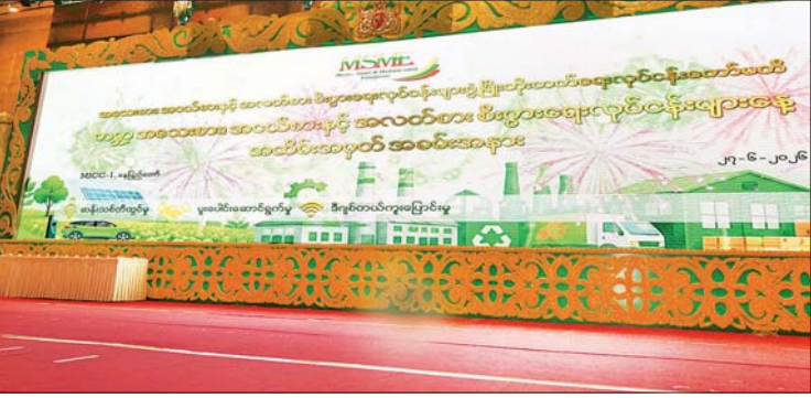
နိုင်ငံတော်သမ္မတ ဦးမင်းအောင်လှိုင် ကမ္ဘာ့အသေးစား၊ အငယ်စားနှင့် အလတ်စား စီးပွားရေးလုပ်ငန်းများနေ့ အထိမ်းအမှတ်အခမ်းအနားတွင် အမှာစကား ပြောကြားစဉ်။

သည့် စိုက်ပျိုးမွေးမြူရေးထွက်ကုန်များကို အပြည့်အဝအသုံးပြုကြရမည်ဖြစ်ကြောင်း၊ သွင်းအားစုများဖြစ်သည့် စက်သုံးဆီ၊ လှုပ်စစ်မီး၊ မြေဩဇာနှင့် ကုန်ထုတ်လုပ်မှု စက်ကိရိယာအစိတ်အပိုင်းများကိုလည်း သင့်တော်သည့်နည်းလမ်းများဖြင့် တီထွင်ကြံဆပြီး လုပ်ဆောင်ကြရန် လိုကြောင်း၊ အထူးသဖြင့် ကုန်ထုတ်လုပ်မှု စရိတ်စကများကို ဖြစ်နိုင်သမျှ လျှော့ချပေးနိုင်ရန်နှင့် ကုန်ထုတ်စွမ်းအားကို ပိုမိုတိုးတက်လာရေးအတွက် လျှပ်စစ်နှင့် စွမ်းအင်ကဏ္ဍများကို ဖြည့်ဆည်းပေးနိုင်ရေးကိုလည်း သက်ဆိုင်ရာဝန်ကြီးဌာနများက အထူးအလေးထားဆောင်ရွက်ပေးကြရမည် ဖြစ်ကြောင်း။