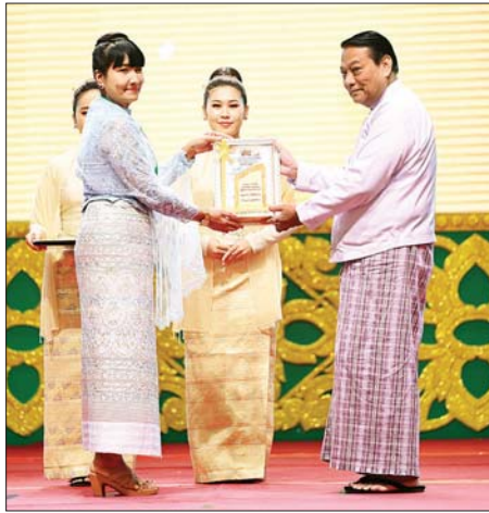
ပြည်သူ့လွှတ်တော်ဥက္ကဋ္ဌ ဦးခင်ရီ ထူးချွန်အဆင့်(၃) MSME လုပ်ငန်းရှင်တစ်ဦးအား ဂုဏ်ပြုတံဆိပ် ချီးမြှင့်ပေးအပ်စဉ်။

တက်ရောက်လာကြသူများသည် ကမ္ဘာ့အသေးစား၊ အငယ်စားနှင့် အလတ်စား စီးပွားရေးလုပ်ငန်းများနေ့အခမ်းအနား အထိမ်းအမှတ်အဖြစ် ဗဟိုကော်မတီနှင့်လုပ်ငန်းကော်မတီ ပြခန်းများ၊ ဗဟိုကော်မတီအဖွဲ့ဝင် ဝန်ကြီးဌာနပြခန်းများ၊ တိုင်းဒေသကြီးနှင့် ပြည်နယ် MSME ထုတ်ကုန်ပြခန်းများ၊ အသေးစားစက်မှုလက်မှုလုပ်ငန်းပြခန်းများ၊ အသင်းအဖွဲ့များအလိုက် ပြခန်းများ စုစုပေါင်းပြခန်းပေါင်း ၁၄၉ ခန်းတွင် ခင်းကျင်းပြသထားသည့် ဒေသထွက် စားသောက်ကုန်ပစ္စည်းများနှင့် အသေးစား၊ အငယ်စား၊ အလတ်စားနှင့် စီးပွားရေးလုပ်ငန်းများ ဖွံ့ဖြိုးတိုးတက်ရေးဝန်ကြီးဌာန ပြည်ထောင်စုဝန်ကြီး ဒေါက်တာချာလီသန်းက ကမ္ဘာ့အသေးစား၊ အငယ်စားနှင့် အလတ်စား စီးပွားရေးလုပ်ငန်းများနေ့ အထိမ်းအမှတ်လက်ဆောင်အား နေရာအရောက် ပေးအပ်သည်။ ထို့နောက် နိုင်ငံတော်သမ္မတသည် အခမ်းအနားတက်ရောက်လာကြသူများနှင့် စုပေါင်းမှတ်တမ်းတင်ဓာတ်ပုံရိုက်ကြသည်။ အခမ်းအနားအပြီးတွင် နိုင်ငံတော်သမ္မတနှင့် အခမ်းအနား