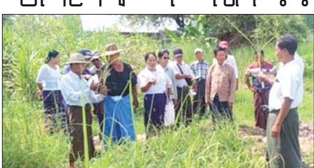
စိုက်ကွက်အမှတ်-B 2 အထူး ဆောင်ရွက်ကြသည်။ အဆိုပါ တောင်သူပညာပေး

လယ်ဝေး ဇွန် ၂၇ ပြည်ထောင်စုနယ်မြေ လယ်ဝေး မြို့နယ်ရှိ ကြံစိုက်တောင်သူများ၏ ကြံသီးနှံအထွက်နှုန်း တိုးတက်စေ ရေးအတွက် ရေမြေရာသီဥတုနှင့် ကိုက်ညီသော ကြံစိုက်နည်းစနစ် များ ဖော်ထုတ်အသုံးပြုနိုင်ရန် တောင်သူပညာပေးဆွေးနွေးပွဲကို ဇွန် ၂၄ ရက်က စိုက်ပျိုးရေးဦးစီး ဌာန သင်တန်းထွက်သီးနှံဌာနခွဲ ကြံမျိုးသန့်ခြံ (ကမ်းပါး)ရှိ