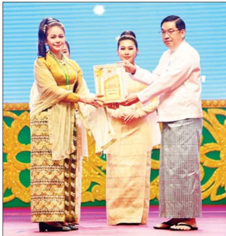
ဒုတိယသမ္မတ ဦးညိုစော ထူးချွန်အဆင့်(၂) MSME လုပ်ငန်းရှင် တစ်ဦးအား ဂုဏ်ပြုတံဆိပ် ချီးမြှင့်ပေးအပ်စဉ်။