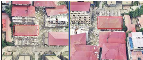
ကရင်ပြည်နယ် မြဝတီခရိုင် ရွှေကုက္ကိုလ်နယ်မြေရှိ အုန်လှိုင်းလိမ်လည်လောင်းကစားမှု လုပ်ကိုင်ခဲ့သည့် တရားမဝင် ခုနစ်ထပ်လူနေအဆောက်အအုံအား ယမ်းဖြင့်ဖောက်ခွဲ ဖျက်ဆီးပြီးစီးမှုကို တွေ့ရစဉ်။

တရားမဝင် ခုနစ်ထပ်လူနေ အဆောက်အအုံတစ်လုံးကို ထပ်မံ ၍ စနစ်တကျ ဖောက်ခွဲဖြိုချ ဖျက်ဆီးခဲ့ကြောင်း သိရှိရသည်။ ရွှေကုက္ကိုလ် နယ်မြေအတွင်း ၌ အုန်လှိုင်းလိမ်လည်လောင်း ကစားလုပ်ငန်းများ ကျူးလွန်ရာ တွင် အသုံးပြုခဲ့သည့် အဆောက် အအုံ ၇၇ လုံးအနက် ယာဉ် ယန္တရားများဖြင့် ဖြိုချဖျက်ဆီးမည့် အဆောက်အအုံ ၅၇ လုံးနှင့် ဖောက်ခွဲ၍ဖျက်ဆီးမည့်အဆောက် အအုံ အလုံး ၂၀ ဟူ၍ အဆောက် အအုံအမျိုးအစားအလိုက် ခွဲခြား သတ်မှတ်ပြီး စနစ်တကျ ဖြိုချ