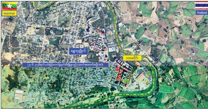
ကရင်ပြည်နယ် မြဝတီမြို့နယ် ရွှေကုက္ကိုလ်နယ်မြေရှိ အွန်လိုင်းလိမ်လည်လောင်းကစားမှုများ လုပ်ကိုင်ခဲ့သည့် တရားမဝင် အဆောက်အအုံများအား ဖောက်ခွဲဖျက်ဆီးမှုပြုပြင်ပုံ။

နေပြည်တော် ဇွန် ၂၇ အွန်လိုင်းလိမ်လည်လောင်းကစား မှုများကို အခြေချလုပ်ကိုင်ခဲ့ကြ သည့် ကရင်ပြည်နယ် မြဝတီ မြို့နယ် ရွှေကုက္ကိုလ်နယ်မြေနှင့် KK Park နယ်မြေများရှိ တရား မဝင် အဆောက်အအုံများအား အပြီးတိုင် ပြိုချပျက်ဆီးခြင်းများ နှင့် လုပ်ငန်းလုပ်ဆောင်ရာတွင် အသုံးပြုခဲ့သည့် ပစ္စည်းများအား စနစ်တကျ ဖျက်ဆီးခြင်းများကို ဌာနဆိုင်ရာ ပူးပေါင်းအဖွဲ့များဖြင့် ဆောင်ရွက်လျက်ရှိရာ ယနေ့တွင် ရွှေကုက္ကိုလ်နယ်မြေ အတွင်းရှိ စာမျက်နှာ ၁၅ ကော်လံ ၁ ■