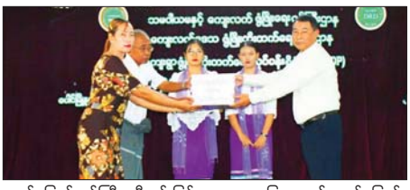
ဆည်မြောင်းဝန်ကြီး ဦးမင်းမြင့် ရေး၊ မွေးမြူရေးနှင့် ဆည်မြောင်းဝန်ကြီးနှင့် စည်ပင်သာယာရေးဝန်ကြီး ဒေါက်တာအောင်မြတ်

ပေါင် ဇွန် ၂၇ မွန်ပြည်နယ် ပေါင်မြို့နယ် ကျေးလက်ဒေသ ဖွံ့ဖြိုးတိုးတက်ရေးဦးစီးဌာန ကျေးရွာဖွံ့ဖြိုးတိုးတက်ရေးလုပ်ငန်း စီမံကိန်းရန်ပုံငွေ လွှဲပြောင်းပေးအပ်ပွဲကို ဇွန် ၂၇ ရက်က မြို့နယ်အထွေထွေအုပ်ချုပ်ရေးဦးစီးဌာန ရုံး၌ ပြုလုပ်ရာ ပြည်နယ်စိုက်ပျိုးရေး၊ မွေးမြူရေးနှင့်