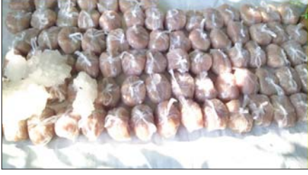
ငါးအသားခြစ်ကုန်ချောများအား ဈေးကွက်သို့ တင်ပို့ရန် ပြင်ဆင်မှု။

ရွှေဘိုခရိုင်၏ ငါးအသားခြစ်လုပ်ငန်းကို လေ့လာရာတွင် လုပ်ငန်းရှင် ငါးဦးက လုပ်သား ၁၅၀ ခန့်ဖြင့် လုပ်ငန်းဆောင်ရွက်လျက်ရှိကြရာ အိမ်ထောင်စု ၁၅၀ ခန့်အား အလုပ်အကိုင်အခွင့်အလမ်းများနှင့် မိသားစုဦးရေ ၁၀၀၀ ခန့်အတွက် ယင်းလုပ်ငန်းမှ အသက်မွေးဝမ်းကျောင်းခြင်းဖြစ်စေ