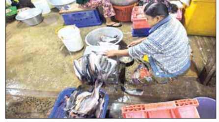
လုပ်သားများ ငါးအသားလွှာနေမှု။

ငါးအသားခြစ်လုပ်ငန်းသည် အသင့်စားသုံးနိုင်သည့် ကုန်ချောဖြစ်သည့်အားလျော်စွာ ချက်ပြုတ်နည်းမျိုးစုံဖြင့် စားသုံးနိုင်ခြင်း၊ ရေရှည်အထားခံခြင်း၊ စာတုဆေးဝါးများ မပါဝင်ဘဲ အရသာရှိခြင်းတို့ကြောင့် လူကြိုက်များသည့် ငါးထုတ်ကုန်တစ်မျိုးဖြစ်ပါသည်။ ယင်းငါးအသားခြစ်များကို ရေခဲရိုက်ဖြင့် ထားရှိပါက တစ်ပတ်အထိ ထားရှိနိုင်ပြီး အေးခဲခြင်းဖြင့် ထားရှိပါက တစ်လအထိ ထားရှိနိုင်ပါသည်။