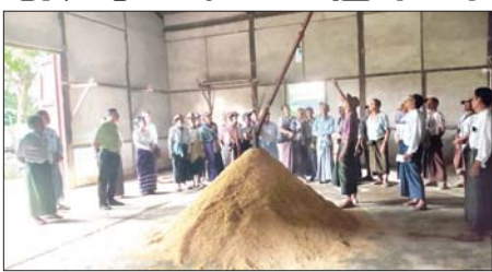
စပါးခွဲ ပေးသွေး၊ သဘာဝမြေဩဇာ (ဘိုင်အိုချာ) ထုတ်လုပ်၍ စပါးခွဲ ပေါင်းခံရည် ထုတ်လုပ်မှု၊ ဘက်စုံ ပြီးပေးရောဂါကာကွယ်ရေးအတွက်