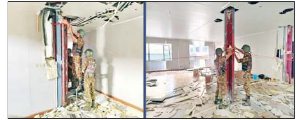
ကရင်ပြည်နယ် မြဝတီခရိုင် ရွှေကုက္ကိုလ်နယ်မြေရှိ အုန်လှိုင်းလိမ်လည်လောင်းကစားမှု လုပ်ကိုင်ခဲ့သည့် တရားမဝင် ခုနစ်ထပ်လူနေအဆောက်အအုံအား ယမ်းဖြင့်ဖောက်ခွဲ ဖျက်ဆီးရန်ပြင်ဆင်နေမှုကို တွေ့ရစဉ်။

ဖျက်ဆီးလျက်ရှိရာ ယနေ့တွင် ဖောက်ခွဲ၍ ဖြိုချဖျက်ဆီးရန် သတ်မှတ်ထားသည့် အဆောက် အအုံ အလုံး ၂၀ အနက် ခုနစ်ထပ် လူနေအဆောက်အအုံတစ်လုံးကို စနစ်တကျ ထပ်မံဖောက်ခွဲ ဖျက်ဆီးခဲ့ကြောင်း သိရှိရသည်။ ဌာနဆိုင်ရာ ပူးပေါင်းအဖွဲ့များ အနေဖြင့် ယနေ့အထိ အုန်လှိုင်း လိမ်လည်လောင်းကစားလုပ်ငန်း များ ကျူးလွန်ရာတွင် အသုံးပြုခဲ့ သည့် တရားမဝင်အဆောက်အအုံ