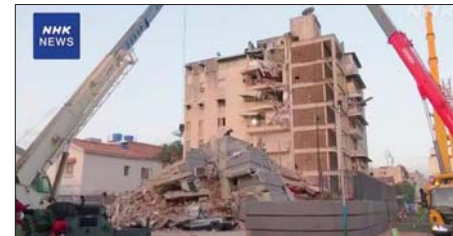
ထိခိုက်ဒဏ်ရာရရှိသူ ၃၃၆၀ ရှိလာပြီဖြစ်ကြောင်း၊ နေအိမ်များနှင့် အခြားအဆောက်အအုံ ၃၈၃ လုံး ဆိုးရွားစွာထိခိုက်ပျက်စီးခဲ့ကြောင်း ဇွန် ၂၆ ရက် မွန်းလွဲပိုင်းတွင် ပြောကြားသည်။ အင်န်အိတ်ချီကော

ဗင်နီဇွဲလား အင်အားပြင်းလျှင် ကြောင့် သေဆုံးသူ ၉၂၀ ရှိလာ ကာရာကတ်၊ ဇွန် ၂၇ - ဗင်နီဇွဲလားနိုင်ငံ၌ ဇွန် ၂၄ ရက်က အင်အားပြင်းထန်သော လူပုဂ္ဂိုလ်များ လှုပ်ခတ်ခဲ့ပြီးနောက် ၄၈ နာရီကျော် ကြာမြင့်လာပြီဖြစ်သဖြင့် အဆောက်အအုံအပျက်အစီးများအောက် ပိတ်မိနေသူများအား ကယ်ထုတ် နိုင်ရေး အချိန်နှင့်အမျှ ဆက်လက်ကြိုးပမ်းဆောင်ရွက်နေကြသည်။ ပြင်းအား ၇ အထက်ရှိ လျှင်နှစ်ခုသည် ဗင်နီဇွဲလားနိုင်ငံ အနောက် မြောက်ပိုင်းတွင် ဇွန် ၂၄ ရက် ညနေပိုင်းက တစ်မိနစ်အတွင်း ဆက်တိုက် လှုပ်ခတ်ခဲ့ခြင်းဖြစ်သည်။ ဗင်နီဇွဲလားလွတ်တော်ကြွင့် ဂျော့ရီဒရိုက်စီက လျှင်လှုပ်ခတ်မှု ကြောင့် အတည်ပြုသေဆုံးသူ ၉၂၀ အထိ ရှိလာပြီဖြစ်ကြောင်းနှင့်