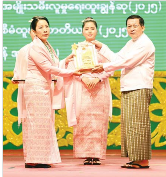
နိုင်ငံတော်သမ္မတ ဦးမင်းအောင်လှိုင် ထူးချွန်အဆင့်(၁) MSME လုပ်ငန်းရှင်တစ်ဦးအား ဂုဏ်ပြုတံဆိပ် ချီးမြှင့်ပေးအပ်စဉ်။