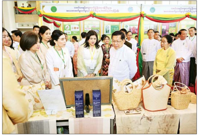
နိုင်ငံတော်သမ္မတ ဦးမင်းအောင်လှိုင် ကမ္ဘာ့အသေးစား၊ အငယ်စားနှင့် အလတ်စား စီးပွားရေးလုပ်ငန်းများနေ့အခမ်းအနား အထိမ်းအမှတ်အဖြစ်ပြုသထားသည့် MSME ထုတ်ကုန်ပစ္စည်းပြခန်းများအား စိတ်ပါဝင်စားစွာ ကြည့်ရှုစဉ်။

စာမျက်နှာ ၄ မှ ထို့ကြောင့် သက်ဆိုင်ရာဝန်ကြီးဌာနများနှင့် တိုင်းဒေသကြီး၊ ပြည်နယ်အစိုးရအဖွဲ့များ အနေဖြင့် ကုန်ထုတ်လုပ်မှုနယ်ပယ်အသီးသီးတွင် ဒေသအလိုက် လုပ်ငန်းကဏ္ဍ ချိတ်ဆက်မှုများ ပိုပြင်စွာ ဖော်ဆောင်နိုင်စေရေးအတွက် လုပ်ငန်းရှင်ကြီးများနှင့် လုပ်ငန်းရှင်ငယ်များအကြား ပေါင်းကူးတတ်သားသဖွယ် စနစ်တကျ ညှိနှိုင်းပေါင်းစပ်ဆောင်ရွက်ပေးသွားကြရန်လိုကြောင်း။ အသေးစား၊ အငယ်စားနှင့် အလတ်စား စီးပွားရေးလုပ်ငန်း (MSME) များသည် မိမိတို့နိုင်ငံ စီးပွားရေး၏ ပဓာနကျသည့် ကျောရိုးမဇ္ဈင်ကြီးဖြစ်ကြောင်း၊ ယင်းကဏ္ဍ ရှေ့ညှိတည်တံ့ခိုင်မြဲပြီး ပိုမိုရှင်သန်ဖွံ့ဖြိုးလာစေခြင်းသည် မိမိတို့နိုင်ငံ၏ စီးပွားရေးအင်အား တောင့်တင်းလာစေရုံ တင်မက ပြည်သူ့ထုတ်ကုန်ရပ်လုံး၏ လူမှုစီးပွားဘဝနှင့် မိသားစုဝင်ငွေများကို တိုက်ရိုက်မြှင့်မားတိုးတက်လာစေမည်ဖြစ်ကြောင်း၊ နိုင်ငံတစ်ဝန်းလုံးတွင် ရှိသည့် အသေးစား၊ အငယ်စားလုပ်ငန်းရှင်များ၊ စတင်ပျိုးထောင်စ (Startup) တည်ထောင်