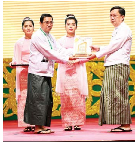
အမျိုးသားလွှတ်တော်ဥက္ကဋ္ဌ ဦးအောင်လင်းဒွေး ထူးချွန်အဆင့်(၃) MSME လုပ်ငန်းရှင်တစ်ဦးအား ဂုဏ်ပြုတံဆိပ် ချီးမြှင့်ပေးအပ်စဉ်။