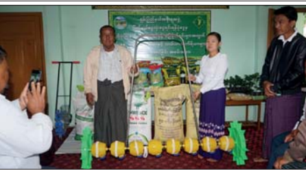
ဟိုပိုးမြို့နယ်၌ မျိုးစေ့၊ ပျိုးပင်၊ မြေဩဇာနှင့် လယ်ယာသုံးစက်ကိရိယာများ ပေးအပ်