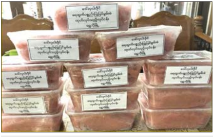
ရွှေဘိုထုတ် MSME ငါးအသားခြစ်ထုတ်ကုန်။

ရွှေဘိုခရိုင်အတွင်း ငါးထုတ်လုပ်မှုမှာလည်း တစ်နှစ်လျှင် ပိသောထောင်ပေါင်း ၅၀၀၀ ကျော်ရှိရာ ဒေသတွင်းပြည်သူလူထု စားသုံးမှုထက် ပိုမိုလှည့်ပတ်မှုကို ရှေ့ပြောင်းအသွေးကောင်းမွန်စေရန်နှင့် ဈေးကောင်းရစေရန် တန်ဖိုးမြှင့်တင်မှုလုပ်ငန်းများအဖြစ် ငါးအသားခြစ်ထုတ်ကုန်လုပ်ငန်း၊ ငါးဆားနယ်လုပ်ငန်းနှင့် ငါးအရေခွံခြောက်စားကုန် လုပ်ငန်းများကို အသေးစား၊ အငယ်စားနှင့် အလတ်စားစီးပွားရေးလုပ်ငန်းများ (MSME)အဖြစ် ဆောင်ရွက်လျက်ရှိကြပြီး ဒေသတွင်းနှင့် ခရိုင်၊ တိုင်းဒေသကြီး၏ ပြင်ပသို့ တင်ပို့