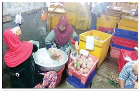
ငါးအသားကျစ်လျစ်စေရန် ဆုပ်နယ်ပေါက်ခြင်း။

ငါးအသားခြစ်ရာတွင် ငါးမြစ်ချင်းငါးမျိုးဖြင့် အဓိကထုတ်လုပ်ကြပြီး တစ်ကောင် ၂၀ ကျပ်သားမှ ၃၀ ကျပ်သားခန့်အရွယ်ရှိ ငါးများကို ဦးစွာဆေးကြောသန့်စင်ပြီး ကျွမ်းကျင်လုပ်သားများက အလယ်ကျောရိုးမှခွဲ၍ ရရှိလာသော ငါးအသားလွှာများကို စတိုးဇွန်းဖြင့်ခြစ်ကာ သန့်ရှင်းသော ပလတ်စတစ်ဇလုံထဲတွင် စုထည့်၍ အနံ့၊ အရသာကောင်းမွန်စေရန် ဆား၊ ချင်း၊ ကြက်သွန်ပြုများကို အချိုးအတိုင်း ရောစပ်ကာ အသေအချာနယ်၍ ကျစ်လျစ်အောင် ပေါက်ကာ အမှာစာပါ အလေးချိန်အတိုင်း ပလတ်စတစ်ခွက်များတွင် ထည့်ပြီး ရေခဲရိုက်ခြင်း၊ အေးခဲခြင်းတို့ဖြင့် တာရှည်ခံအောင် ထုပ်ပိုးရောင်းချကြပါသည်။ ငါးအသားခြစ်ရာတွင် ကုန်ကြမ်းတစ်ပိသောလျှင် ကုန်ချော ၃၅ ကျပ်သား ခန့်ရရှိပြီး ကုန်ကြမ်းငါးများကို မခြစ်မီ တစ်ညရေခဲဖြင့် ညသိပ်ထားပြီး နောက်တစ်နေ့တွင် လုပ်သားများက ကုန်ချောထုတ်လုပ်ကြပါသည်။