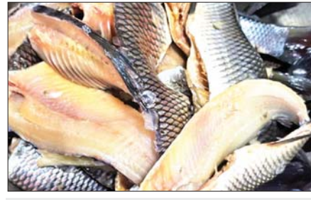
ငါးမြစ်ချင်းအသားလွှာခြင်း လုပ်ငန်း။

အသားတင်ထုတ်လုပ်မှု ဂျီဒီပီတိုးတက်လျက်ရှိနေပါသည်။ လုပ်သားများအနေဖြင့် အမျိုးသမီးများက လုပ်ကိုင်နိုင်သည့်အတွက် ငါးကဏ္ဍအမျိုးသမီးများ အလုပ်အကိုင်ပါဝင်မှု (Gender Ratio)ကို မြှင့်မားစေပါသည်။