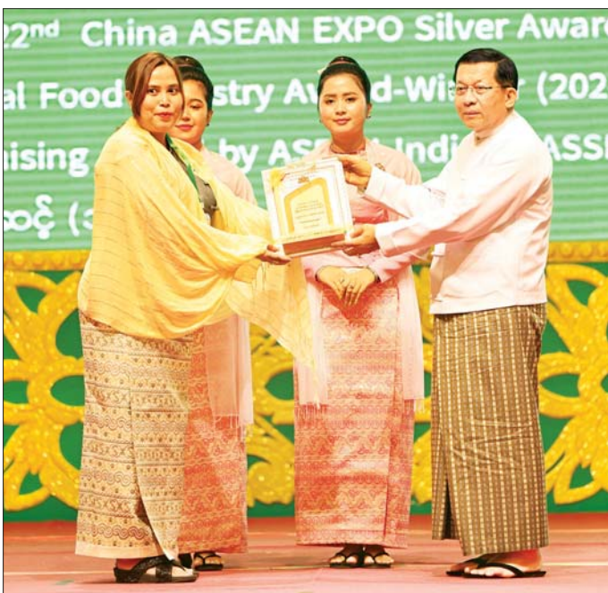
နိုင်ငံတော်သမ္မတ ဦးမင်းအောင်လှိုင် ထူးချွန်အဆင့်(၁)ရရှိသည့် MSME လုပ်ငန်းရှင်တစ်ဦးအား ဂုဏ်ပြုတံဆိပ် ချီးမြှင့်ပေးအပ်စဉ်။

နေပြည်တော် ဇွန် ၂၇ အသေးစား၊ အငယ်စားနှင့် အလတ်စား စီးပွားရေးလုပ်ငန်းများ ဖွံ့ဖြိုးတိုးတက်ရေးလုပ်ငန်းကော်မတီ၊ ကမ္ဘာ့အသေးစား၊ အငယ်စားနှင့် အလတ်စားစီးပွားရေးလုပ်ငန်းများနေ့ (World MSME Day) အထိမ်းအမှတ်အခမ်းအနားကို ယနေ့နံနက်ပိုင်းတွင် နေပြည်တော်ရှိ မြန်မာအပြည်ပြည်ဆိုင်ရာ ကုန်ဗဟိုဌာန-၁ (MICC-1) ၌ ကျင်းပပြုလုပ်ရာ ပြည်ထောင်စုသမ္မတ မြန်မာနိုင်ငံတော် နိုင်ငံတော်သမ္မတ ဦးမင်းအောင်လှိုင် တက်ရောက်အမှာစကား ပြောကြားသည်။