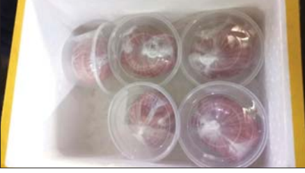
ငါးအသားခြစ်ကုန်ချောများအား ဈေးကွက်သို့ တင်ပို့ရန် ပြင်ဆင်မှု။

နိုင်ငံငယ်နန်း(ငါးဦးစီး) ချမ်းမြေ့ဝင်း(ရွှေဘိုငါးဦးစီး) ချမ်းအေးသူ(ရေဦးငါးဦးစီး)