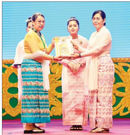
ဒုတိယသမ္မတ ဒေါ်နန်းနီနီအေး ထူးချွန်အဆင့်(၂) MSME လုပ်ငန်းရှင် တစ်ဦးအား ဂုဏ်ပြုတံဆိပ် ချီးမြှင့်ပေးအပ်စဉ်။

“ MSME လုပ်ငန်းရှင်များအနေဖြင့် ကုန်ထုတ် လုပ်မှုနှင့် ဝန်ဆောင်မှုကဏ္ဍများတွင် ငွေကြေး စီးဆင်းမှု မြန်ဆန်ချောမွေ့စေရေးအတွက် ဒီဂျစ် တယ် ငွေပေးချေမှုစနစ်များကို ကျယ်ကျယ်ပြန့်ပြန့် အသုံးပြုခြင်း၊ မိမိတို့၏ ကုန်ပစ္စည်းများကို ဒေသ တွင်းမှ ကမ္ဘာ့ဈေးကွက်အထိ ထိုးဖောက်နိုင်ရေး အတွက် ဒီဂျစ်တယ်ရောင်းဝယ်ဖောက်ကားမှု ပလက်ဖောင်း (E-commerce Platforms) များကို လက်တွေ့အသုံးပြုပြီး ဈေးကွက်ရှာဖွေခြင်း တို့ကို ဆက်လက်လုပ်ဆောင်သွားကြရန်လိုအပ် ”