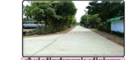
ဝှမြို့နယ် ရဟိုင်းကူးတိုကျေးရွာအုပ်စု၊ ရဟိုင်းကူးကျေးရွာတွင် တွန့်ကရစ်လမ်းအဖြစ် အဆင့်မြှင့်တင်ခြင်းလုပ်ငန်း ဆောင်ရွက်ပြီးစီးမှု

ကမ္ဘာ့ဘဏ်၏ အကူအညီအထောက်အပံ့ဖြင့် လူထုပဟိုပြုစီမံကိန်း ဆောင်ရွက်ခြင်း