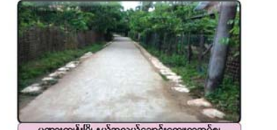
ပုဏ္ဏားကျွန်းမြို့နယ်အလယ်ပျောင်းကျေးရွာအုပ်စု၊ မြစ်နာပြင်ကျေးရွာတွင် တွန့်ကရစ်လမ်း အဆင့်မြှင့်တင်ခြင်းလုပ်ငန်း ဆောင်ရွက်ပြီးစီးမှု

ဝှမြို့နယ်ရှိ ကျေးရွာအုပ်စု(၉)အုပ်စု၊ ကျေးရွာ(၁၄)ရွာ → လမ်းတံတား(၁၀)ခု၊ စာသင်ကျောင်း(၃) ခုနှင့် ရေပေးရေး (၁)ခု စုစုပေါင်းလုပ်ငန်း(၁၄)ခု ဆောင်ရွက်ပြီးစီးခဲ့ ပုဏ္ဏားကျွန်းမြို့နယ်ရှိ ကျေးရွာအုပ်စု (၄)အုပ်စု၊ ကျေးရွာ(၆)ရွာ → လမ်းတံတား(၅)ခုနှင့် ရေပေးရေး (၁)ခု စုစုပေါင်း လုပ်ငန်း(၆)ခု ဆောင်ရွက်ပြီးစီးခဲ့