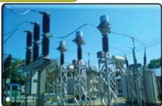
စစ်တွေ ဓာတ်အားခွဲရုံတွင် ၆၆/၁၁ ကေစီ ၅ အမီစီအေ ထရန်စဖော်မာ တိုးချဲ့တပ်ဆင် ဆောင်ရွက်ပြီးစီးခြင်း