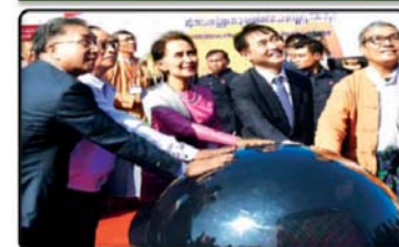
မာန်အောင်မြို့ နေရောင်ခြည်စွမ်းအင်သုံးလျှပ်စစ်ဓာတ်အားပေးစက်ရုံမှ (၁၃-၁၁-၂၀၁၉) ရက်နေ့တွင် ဓာတ်အားတင်ဖြန့်ဖြူးပေးနေပြီး (၁၉-၁၂-၂၀၁၉)ရက်နေ့တွင် ဖွင့်လှစ်ခဲ့ပါသည်။